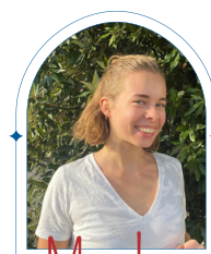
Maëlys CM Santé mentale