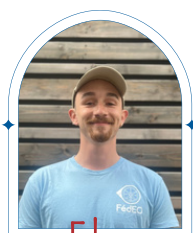
Eloi VP Evènementiel